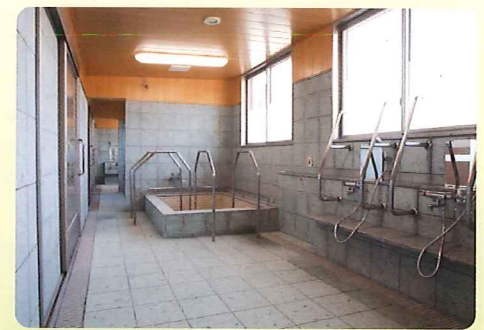
【浴室】 広い入浴室で安心してお風呂に入れます。