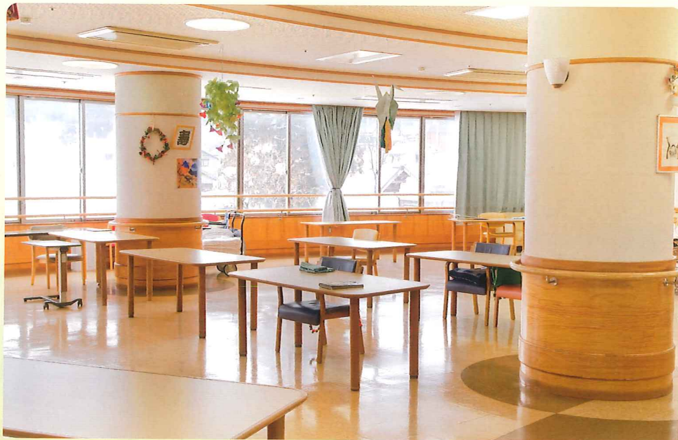
【食堂】 入所者の食事や地域の皆様との交流の場です。

在宅で介護されている家族の方の介護疲れや介護者不在の時など、短期間七川荘で長期入所者と共に生活していただけます。