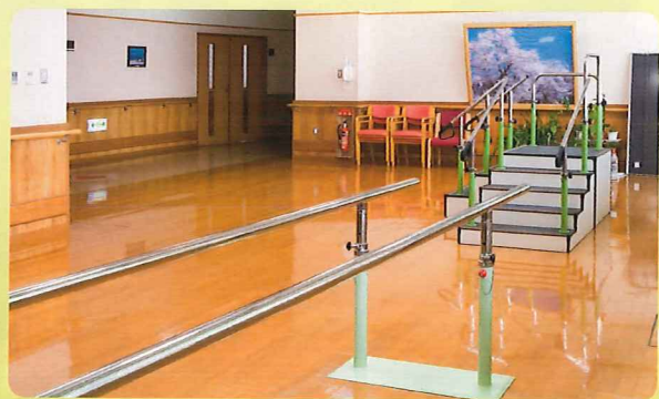
【機能回復訓練室】 階段や平行棒を使って、機能訓練を行います。