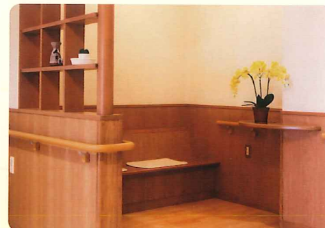
【談話室】 楽しく語りましょう。