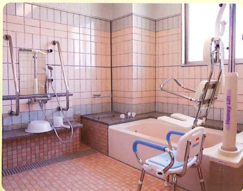
【浴室】 安心して入浴できます。