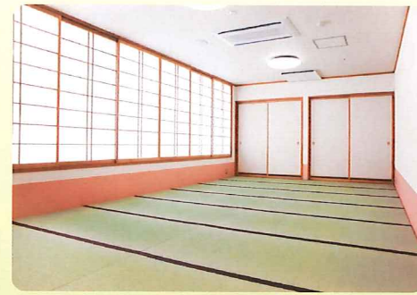
【和室】 休憩をしたり仲間とのコミュニケーションを図ります。