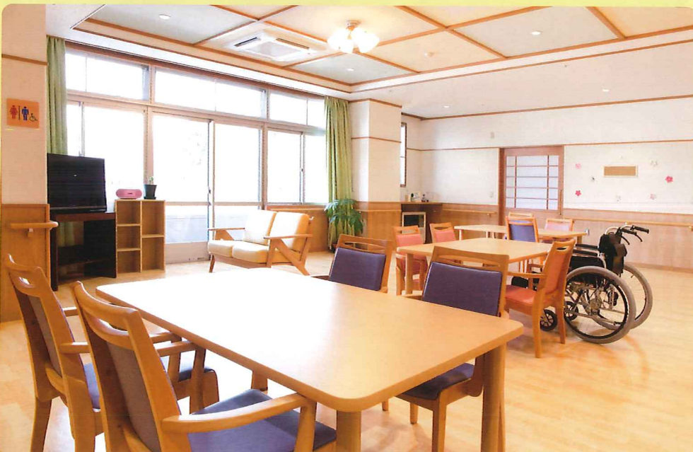
【ホール】 食事をしたり、仲間と地域のみなさんとの交流の場です。