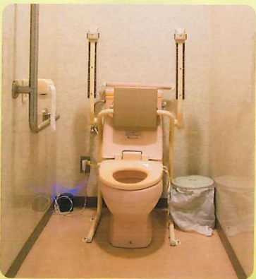
【トイレ】 暖房付きで快適です。