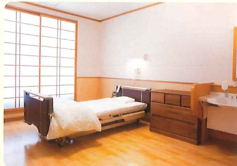
【個室】 ユニット内はすべて個室です。

家族の方の介護の疲れや介護者不在の時など、短期間七川荘やすらぎで安心して日常生活をしていただけます。