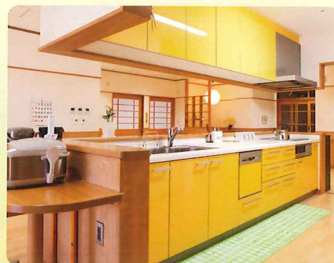
【キッチン】 みなさんの食事をおもてなし。