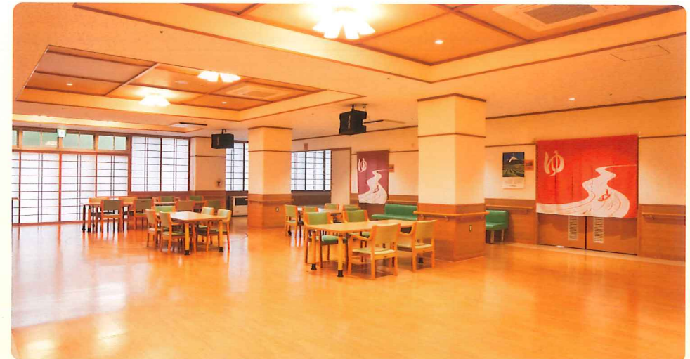
【食堂・機能訓練室】 食事や機能訓練・クラブ活動などを行ない、一日楽しく過ごします。

定員は35名です。日帰りで入浴や食事、リハビリやコミュニケーションの場をご用意いたします。朝と夕方ご自宅まで送迎いたします。